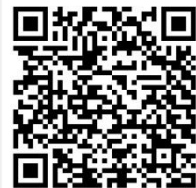
寒假社團&班遊活動