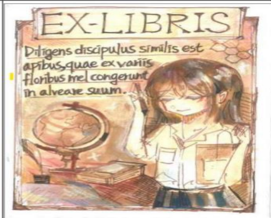
優等 作者：302 班蕭●芯