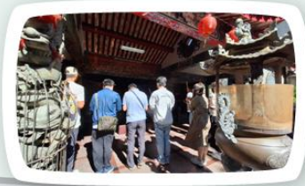
20251105 土地公廟祈福 會長、校長、主任們 與家委一起前往學校 最近的土地公廟為高 三考生祈福。