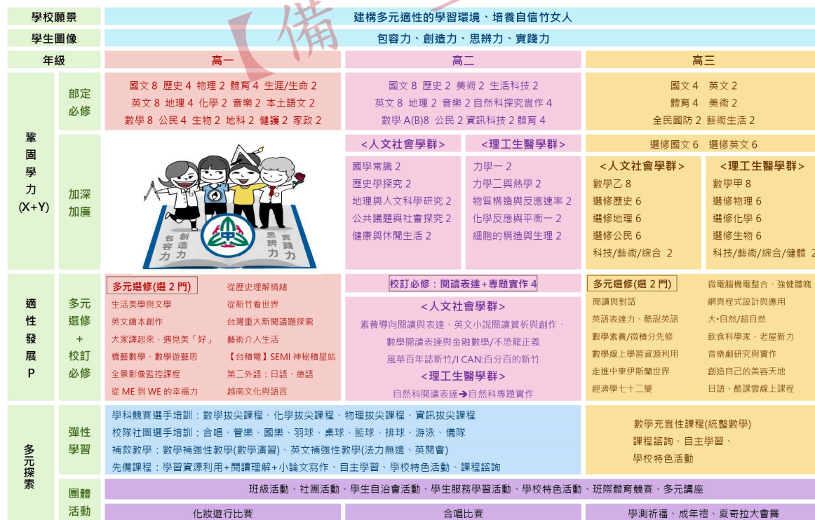
國立新竹女子高級中學 113 學年度入學新生課程地圖