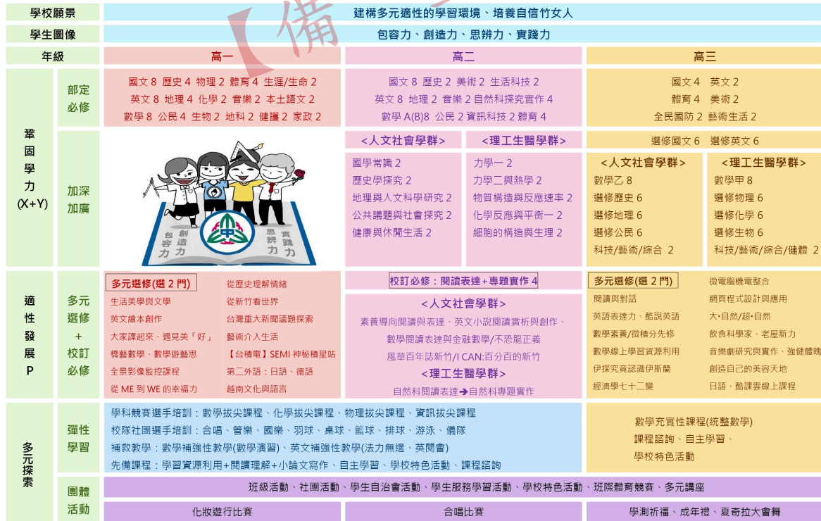
國立新竹女子高級中學 113 學年度入學新生課程地圖